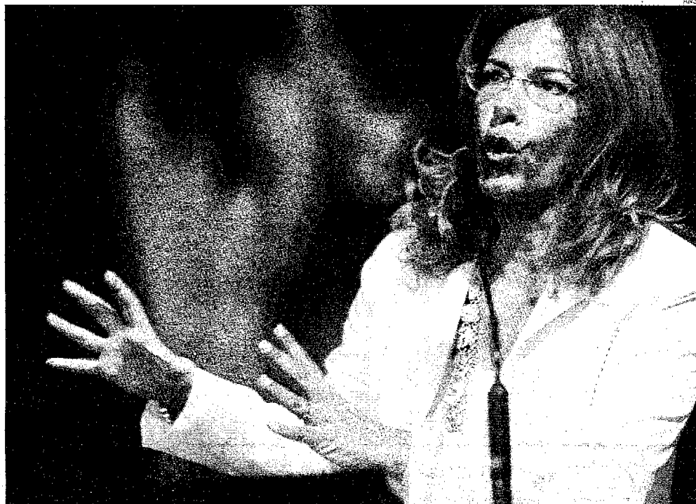
Emma Marcegaglia, presidente di Confindustria